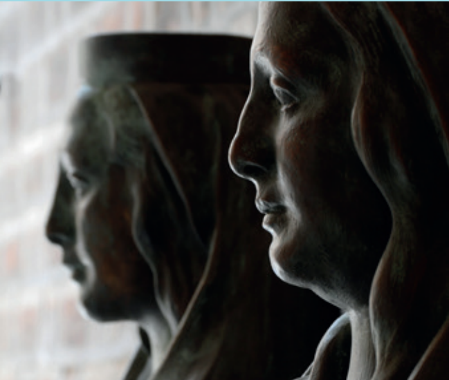
Busty Elišky Rejčky a Elišky Pomořanské v Královské předsíni Katedrály sv. Ducha