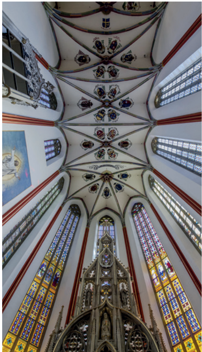
Katedrála sv. Ducha interiér